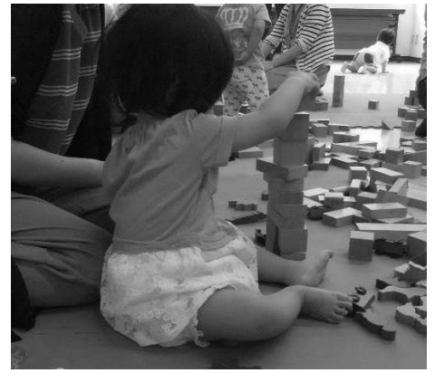
真剣に積み上げています♥

このように、積み木は親子のふれあいのツールとなっています。また、みんな一緒に積み木で遊ぶため、お母さん同士の会話も弾み、和やかな雰囲気の中、積み木遊びを楽しまれています。