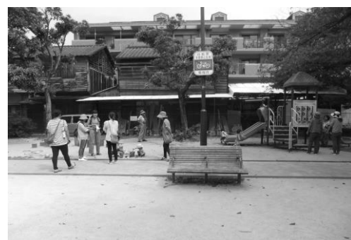
鳥飼南公園。プラザから歩いて5分のところにあります。

プレーパークとは、公園遊びのことで「一人ではなんとなく出かけにくい…」とのママたちの声を受け、その第一歩のお手伝いになればと始めました。プラザから外遊びのおもちゃを持ち込んでいますので、着替えと飲み物を準備して、遊びに来てみませんか？